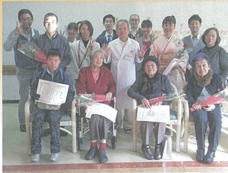
前回ほほえみ俳句・川柳授賞式

病院や在宅でリハビリを行ったり、その援助にあたった時、日々の生活でふと心に湧き上がってきた思いを五七五で表現してください。リハビリに限らず、ほほえみがこぼれるような内容であれば、どんなことでも構いません。詳しくは自由会ホームページをご覧ください。皆様のご応募、お待ちしております。